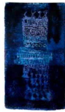
Finska ryor, 4/07.