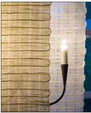
Vävbeskrivning Panellängd med Mattlin 3/06.