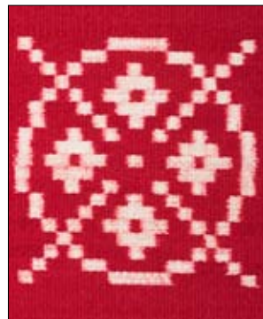
Artikel, Eva Stephenson-Möller 2/07.