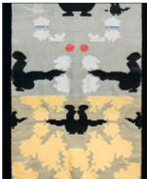
Artikel, Kaisa Melanton 1/07.