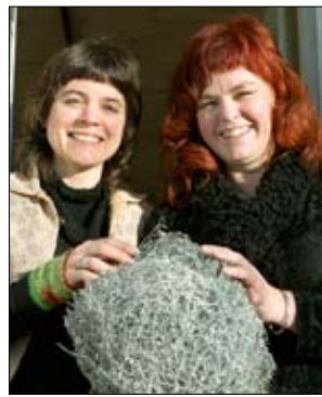
Artikel om Aranea 3/06.