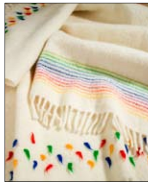
Vävbeskrivning Filt med tofade tofsar 4/06.